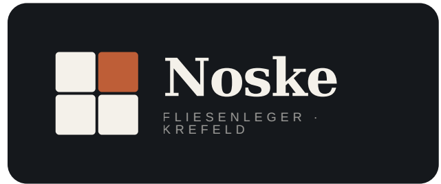
Negativ · auf dunklem Grund